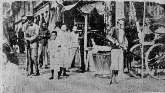
En Shanghai, tropas chinas guardando el barrio europeo